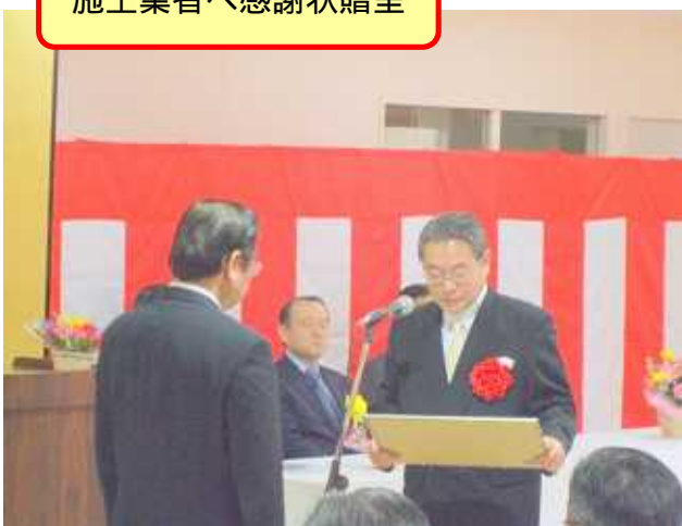
施工業者へ感謝状贈呈