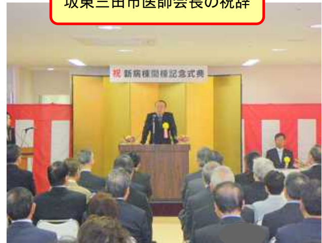
坂東三田市医師会長の祝辞